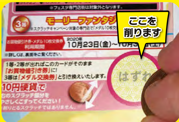
スクラッチ部分を削ると